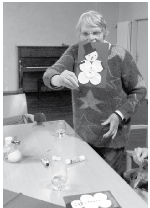
Basteln im Seniorenkreis