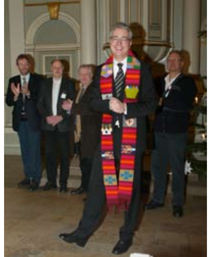
Mit neuer Stola