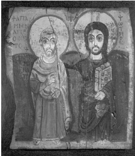
Freundschaftsikone „Presses de Taizé“

4. März, 6. Mai, 5. August, jeweils um 18 Uhr.