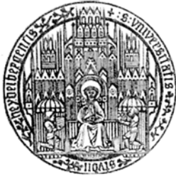
Siegelabdruck der Universität Heidelberg

Ein Stundenplan. Ein Zimmer im Wohnheim. In Ruhe lesen. Vorlesungen und Seminare besuchen. Glaubensinhalte überdenken und kirchliche Handlungsweisen diskutieren. Anschluss finden an die aktuellen Fragen, Methoden und Erkenntnisse der theologischen