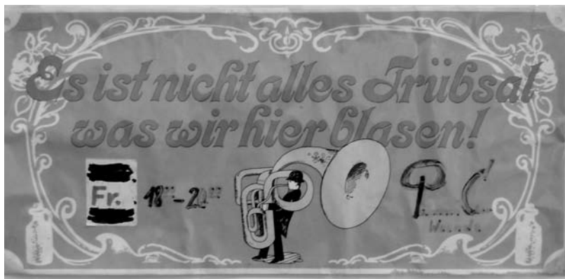
Das Türschild am Probenraum sagt alles...