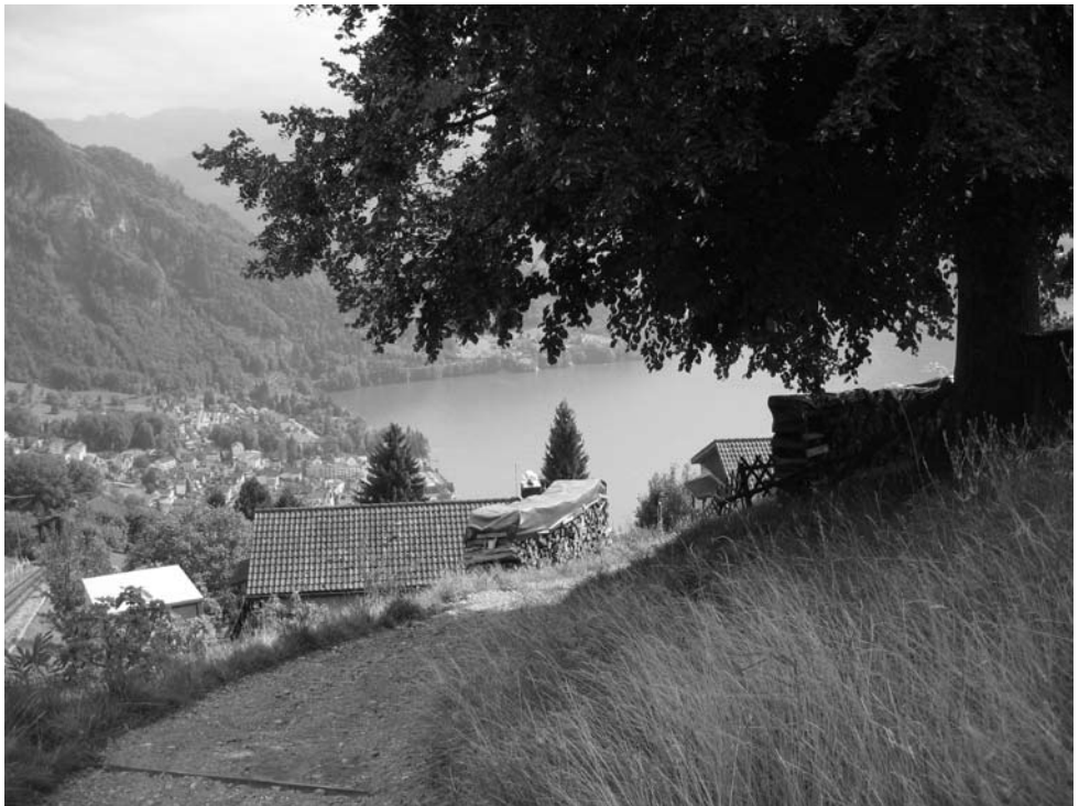
Am Vierwaldstätter See.

Diese Angaben können aus rechtlichen Gründen online nicht dargestellt werden.