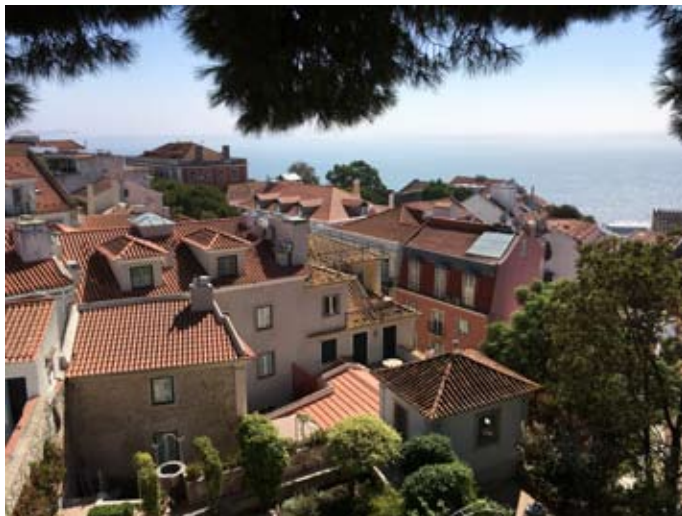
Geschachtelt: Über den Dächern von Lissabon.